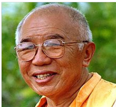
Tulku Urgyen Rinpoche. Segundo maestro de meditación de Varela

Comprendió, el “espíritu de los tiempos ” y como dijo un coreógrafo cubano con otras palabras: