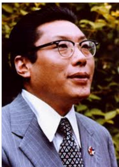
Lama y Maestro de Meditación Chögyam Trungpa, primer maestro de Meditación de Varela

Varela asistió a un seminario intensivo de Vajradhatu de 1976 con Trungpa Rimpoche. Una reunión de 350 o más meditantes que se preparaban estudiando y meditando 10 horas al día, durante 11 semanas. Tomó excelentes apuntes, por su orden y concisión, de una parte de sus apuntes se hizo un cuadro resumen. Uno de estos cuadros fue traducido como “Los Siete Puntos del Adiestramiento Mental”, del tibetano: Lojong.